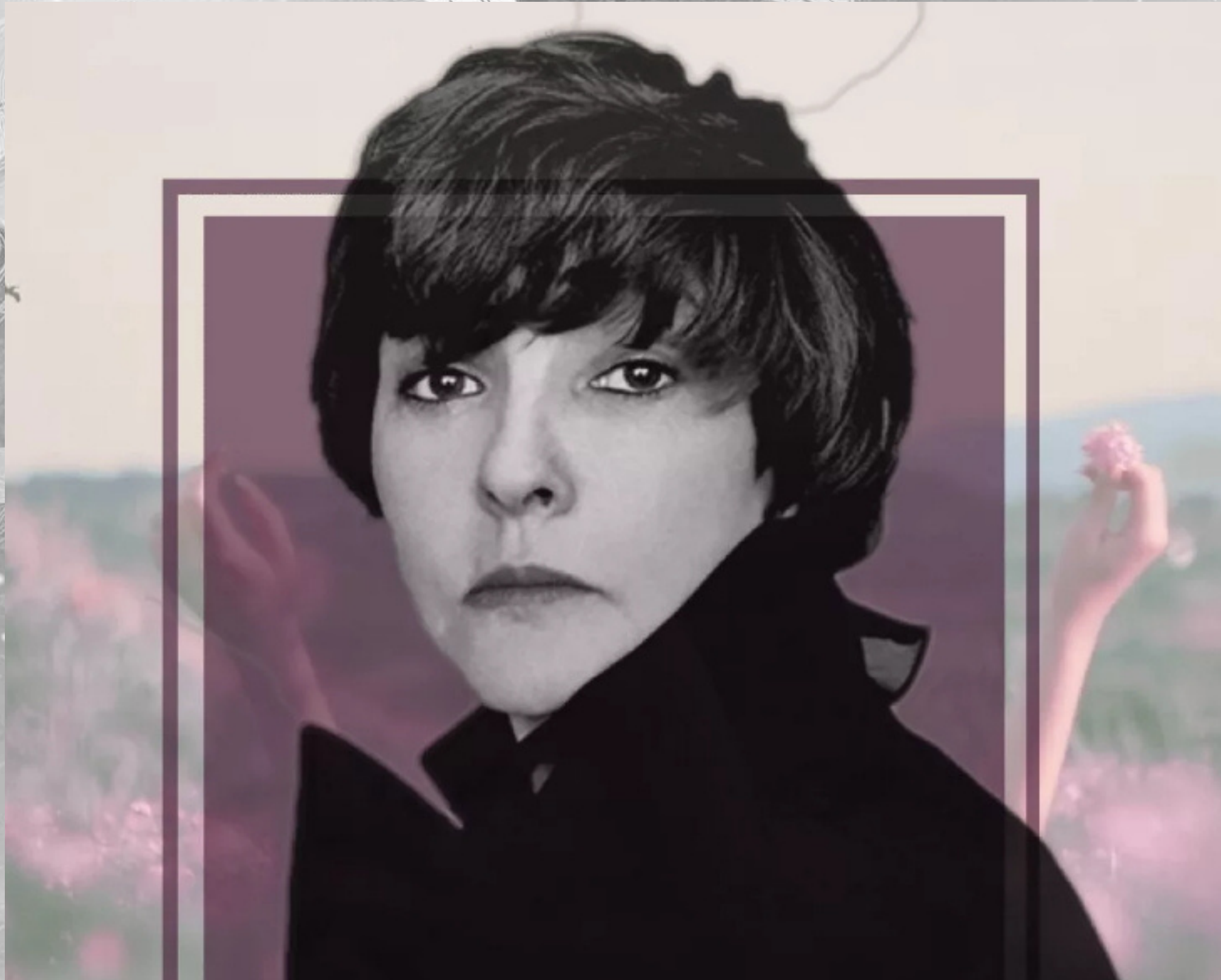
Белла Ахатовна Ахмадулина (к 85 -летию со дня рождения)